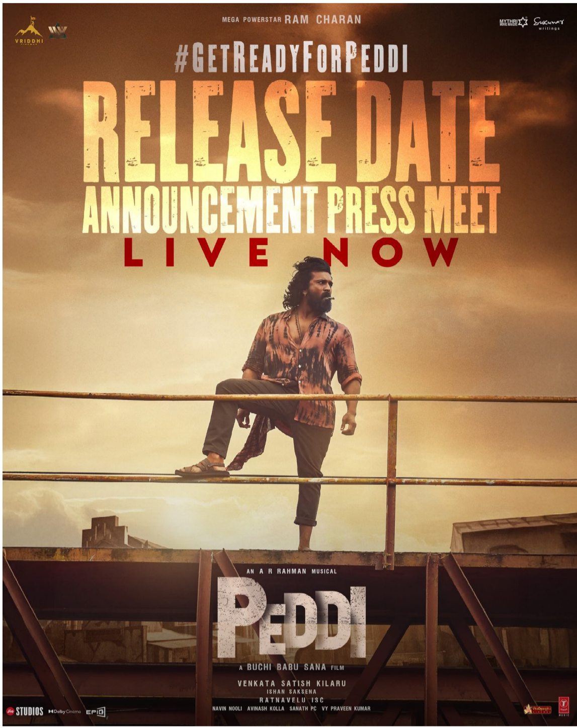
సృష్టిస్తుండే చూడాలంటే మరికొద్ది రోజులు వేచి చూడాలి.