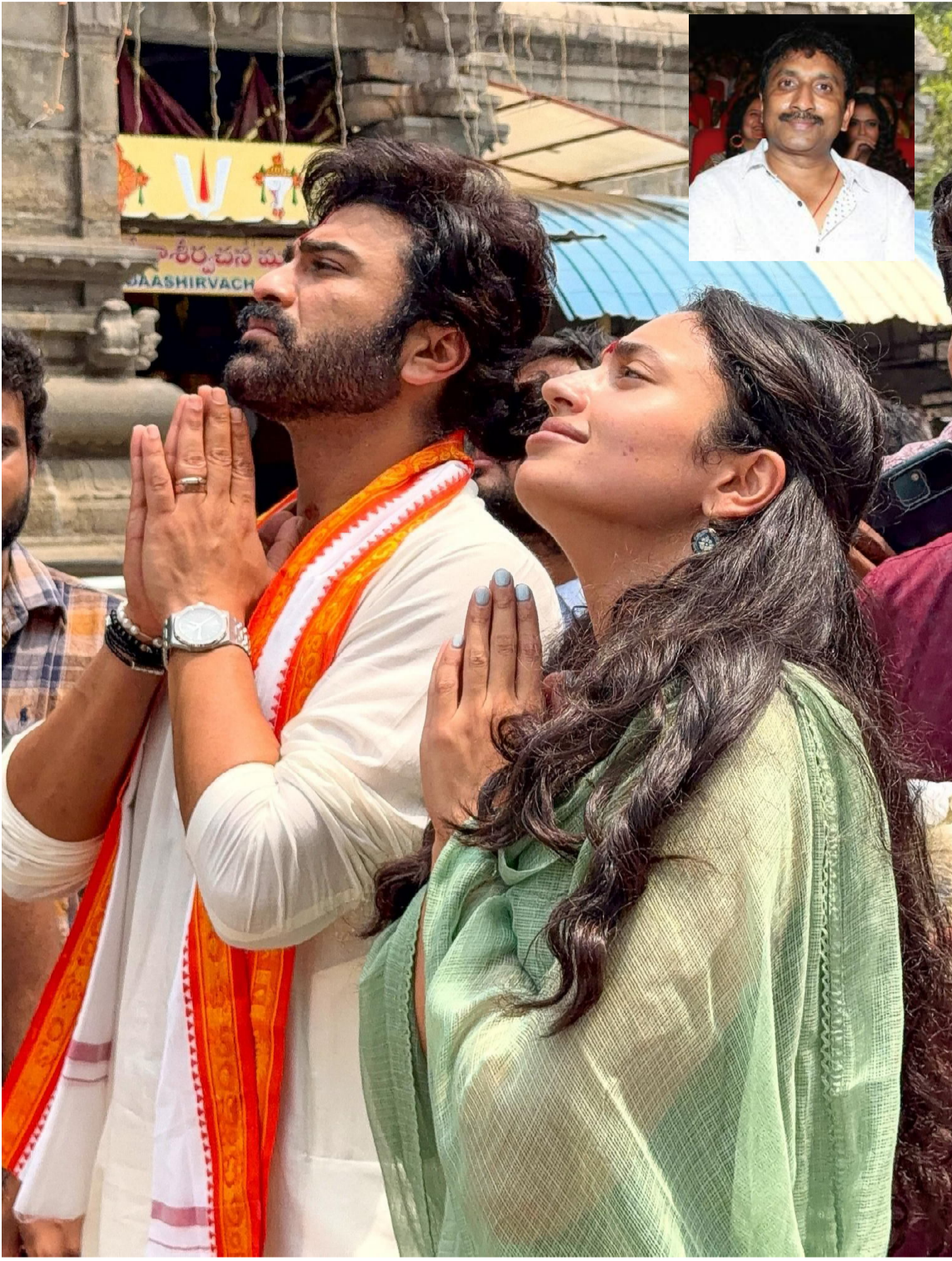
శర్వానంద్-మానస జోడీ వెండితెరపై కొత్త ఫీల్ను తీసుకురావడం ఖాయమనే అభిప్రాయం వ్యక్తమవుతోంది. ప్రస్తుతం కథా పనులు తుది దశకు చేరుకున్నాయని, త్వరలోనే చిత్రబృందంపై అధికారిక ప్రకటన వచ్చే అవకాశం ఉందని సమాచారం.