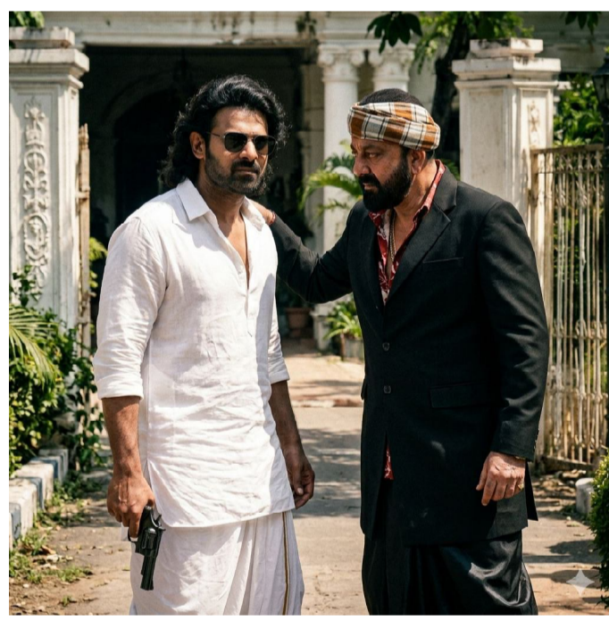
కూడా కీలక పాత్రలు పోషిస్తున్నారు. ప్రస్తుతం షూటింగ్ దశలో ఉన్న ఈ చిత్రం 2027 మార్చి 5న ప్రపంచవ్యాప్తంగా భారీ స్థాయిలో విడుదల కానుంది.