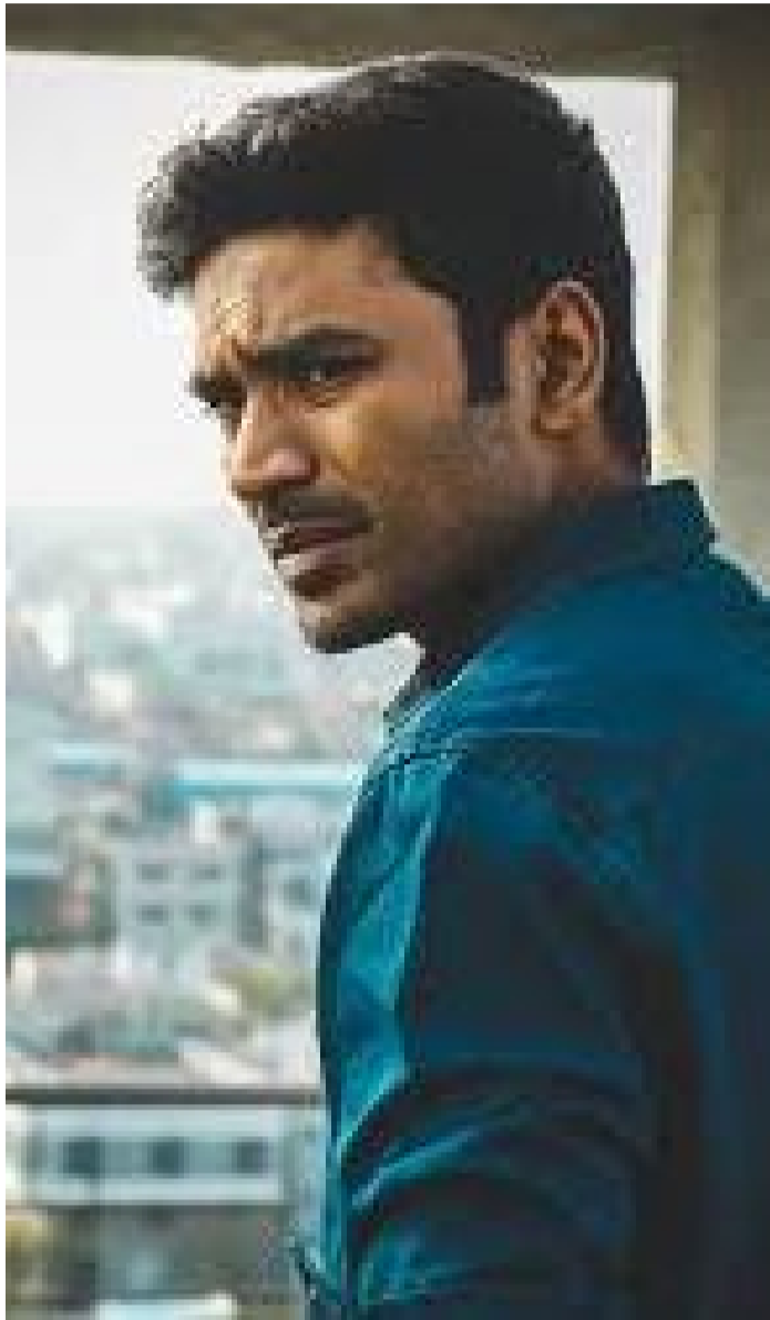
చెప్పారు. తమ కుటుంబ ఆర్థిక పరిస్థితిని పూర్తిగా మార్చిన చిత్రం ధనుష్ మొదటి