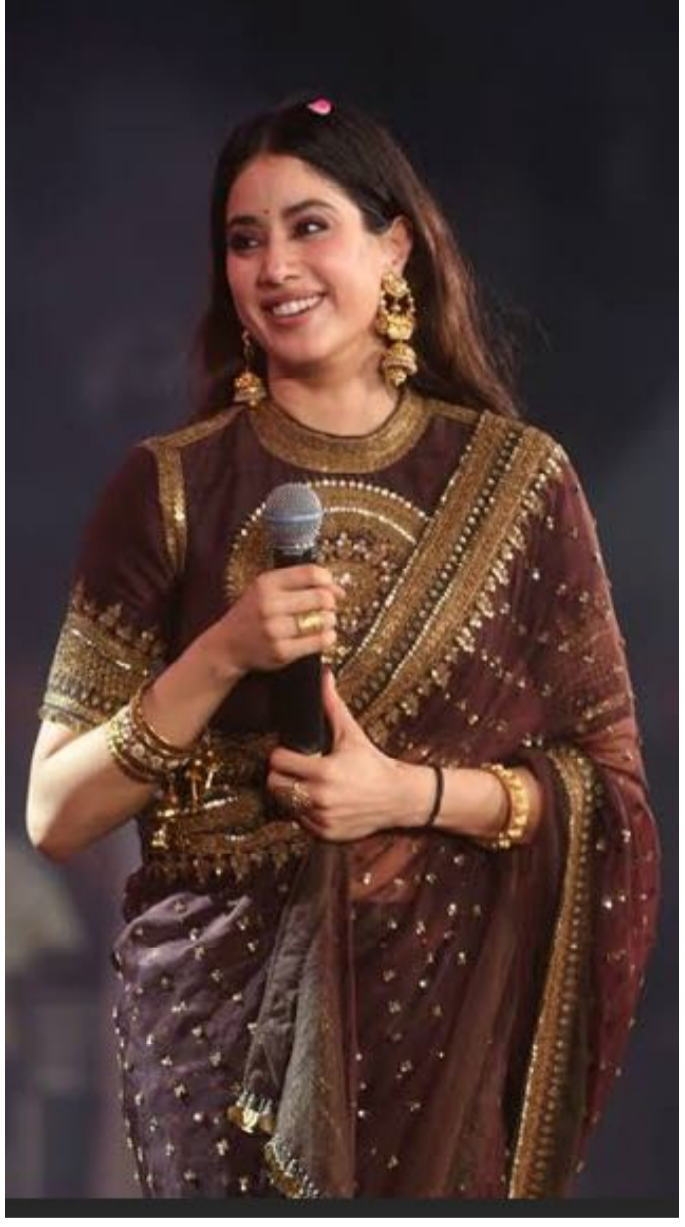
ంటుందని ఆమె అభిప్రాయపడింది. అంతేకాకుండా దేవర, పెద్ది సినిమాల షూటింగ్ సమయంలో తాను రోజుకు 9 గంటలకు మించి ఎప్పుడూ పని చేయలేదని స్పష్టం చేసింది.