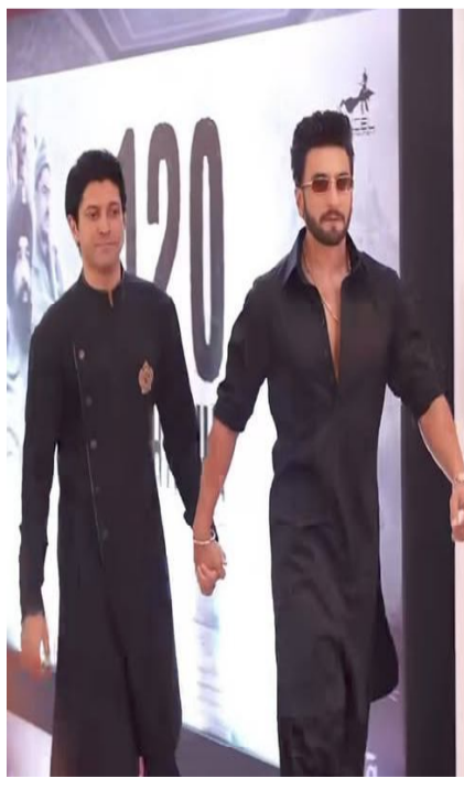
ఇస్తుంది అని చెప్పారు.

ఎఫ్ డబ్ల్యూఐసీఈ ప్రకటన జారీ చేసిన విషయం తెలిసిందే. దీనిపై నటుడి టీమ్ స్పందిస్తూ.. ఆయనకు వృత్తిపై అపారమైన గౌరవం ఉందని తెలిపింది. సినీమా హిట్ కావాలని కోరుకుంటారని అందుకే ఈ వివాదంపై మౌనంగా ఉంటున్నారని వెల్లడించింది. ఈ క్రమంలో బాలీవుడ్ స్టార్ హీరో రణవీర సింగ్ కు పెద్ద ఉపశమనం లభించింది. ఆయనపై విధించిన నాన్-కోఆపరేషన్ నిర్ణయాన్ని వెనక్కి తీసుకుంటున్నట్లు ఫెడరేషన్ ఆఫ్ వెస్ట్రన్ ఇండియా సినీ ఎంప్లాయిస్ బుధవారం ప్రకటించింది. ఫర్మాన్ అక్తర్ సినీమా 'డాన్ 3' నుండి రణవీర తప్పుకోవడంతో ఈ వివాదం మొదలైన సంగతి తెలిసిందే. ఈ క్రమంలో రణవీర సింగ్ సదరు సంస్థకు లీగల్ నోటీసు పంపిన కొద్ది గంటల్లోనే ఈ నిర్ణయం తీసుకోవడం విశేషం. ఇండియన్ మోషన్ పిక్చర్ ప్రొడ్యూసర్స్ అసోసియేషన్, ప్రొడ్యూసర్స్ గిల్డ్ ఆఫ్ ఇండియా, మరియు సినీ / టీవీ ఆర్టిస్ట్స్ అసోసియేషన్ లు ఈ గొడవలో జోక్యం చేసుకుని నర్మలైజింగ్ తో సమస్య సర్దుమణిగినట్లు తెలుస్తుంది. ఈ విషయంపై ప్రెసిడెంట్ బి.ఎన్. తివారీ మాట్లాడుతూ.. సినీ అసోసియేషన్ అభ్యర్థన మేరకు రణవీర సింగ్ పై ఉన్న నాన్-కోఆపరేషన్ ఆదేశాలను వెంటనే రద్దు చేస్తున్నాం. నిర్మాతలు, దర్శకులు లేదా నటులకు ఎలాంటి ఇబ్బంది కలగకుండా అందరం కలిసి కూర్చుని మాట్లాడుకుంటాం. ఈ గొడవలో ఎవరూ గెలవలేదు, ఎవరూ ఓడిపోలేదు. రణవీర పంపిన నోటీసుకు మా లీగల్ టీమ్ సమాధానం